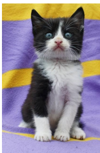
Urban — sretno udomljeni mačić