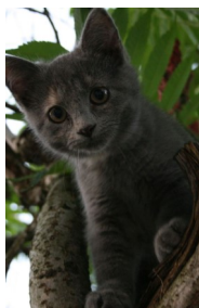
Kimi je prvo zaštitno lice naših stranica

Ako ste prvi iz vaše županije, moći ćete imati ulogu koordinatorice projekta za pojedinu županiju.