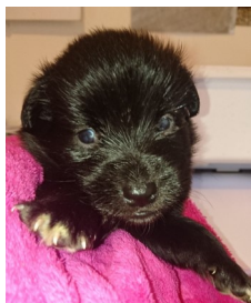
Bolesna i majušna Mrvica čeka da brzo ozdravi i nađe dom