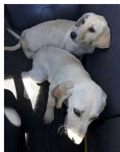
Ostavljene i preplašene labradorice

OŠ Ivana Kukuljevića Sakcinskog, Ivanec Hrvatska mreža školskih knjižničara